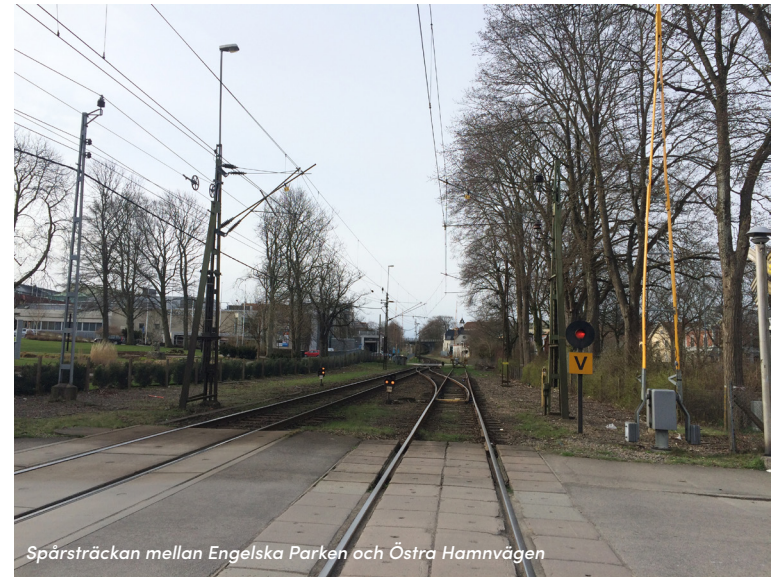
Spårsträckan mellan Engelska Parken och Östra Hamnvägen

I centrum har spåret legat som en barriär mellan Societetsparken och Engelska parken. Båda parkerna hör till Varbergs mest besökta platser och mellan parkerna rör sig väldigt mycket folk, speciellt sommartid. Engelska parken som en grön oas, erbjuder blomsterprakt, plats för vila,