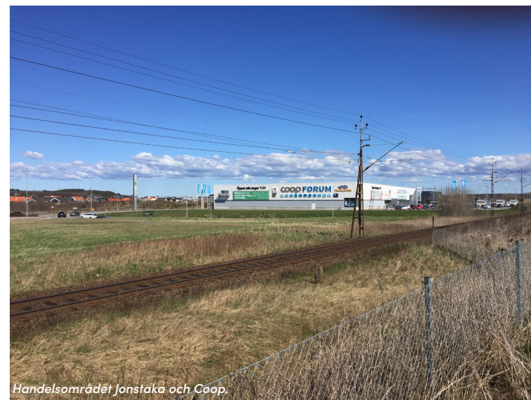
Handelsområdet Jonstaka och Coop.

Potential: Det finns möjligheter att nyttja spårsträckningen för ett rekreativt rörelsestråk som sammanstrålar med befintliga rörelsestråk i Vare. Kan spåret fungera som del av en ridväg, ett motionsspår eller en cykelväg med mer rekreativ utformning?