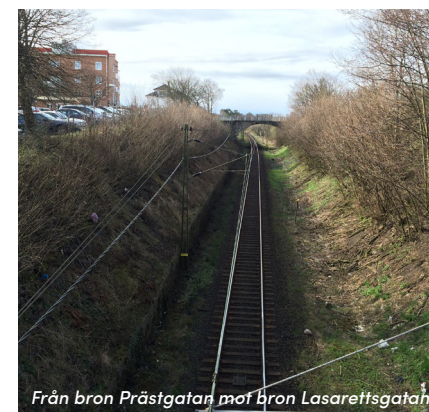
Från bron Prästgatan mot bron Lasarettsgatan