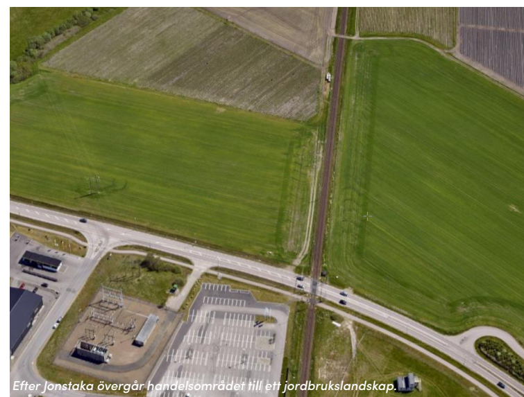
Efter Jonstaka övergår handelsområdet till ett jordbrukslandskap.