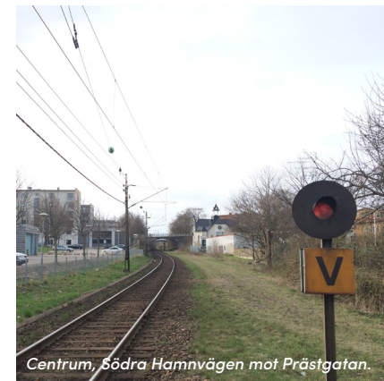
Centrum, Södra Hamnvägen mot Prästgatan.

Risk: Om man förlänger Östra Hamnvägen / Mathilda Ranch allé för biltrafik ända upp till Lasarettsgatan, tillskapas en ny kraftfull barriär i stadens centrum. Ur ett ekologiskt perspektiv och ur ett barn- och tillgänglighetsperspektiv är detta scenario inte önskvärt. Inte heller ur ett kulturmiljöintresse förordas en uppfyllnad av tråget.