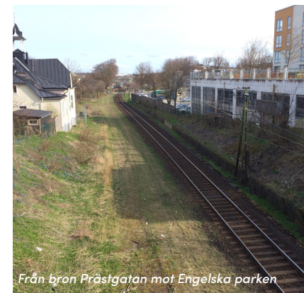
Från bron Prästgatan mot Engelska parken